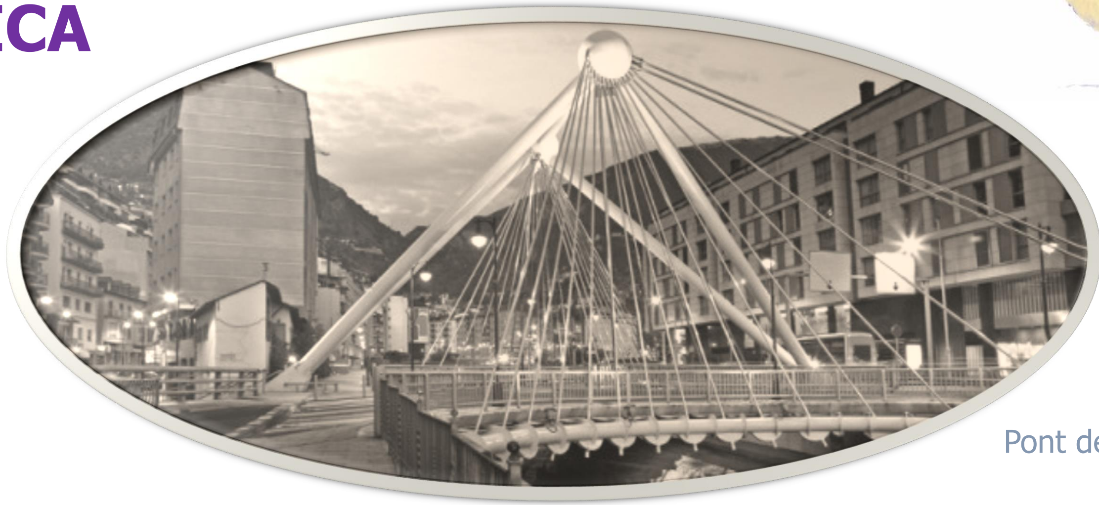
Pont de Paris. Andorra La Vella (Andorra)